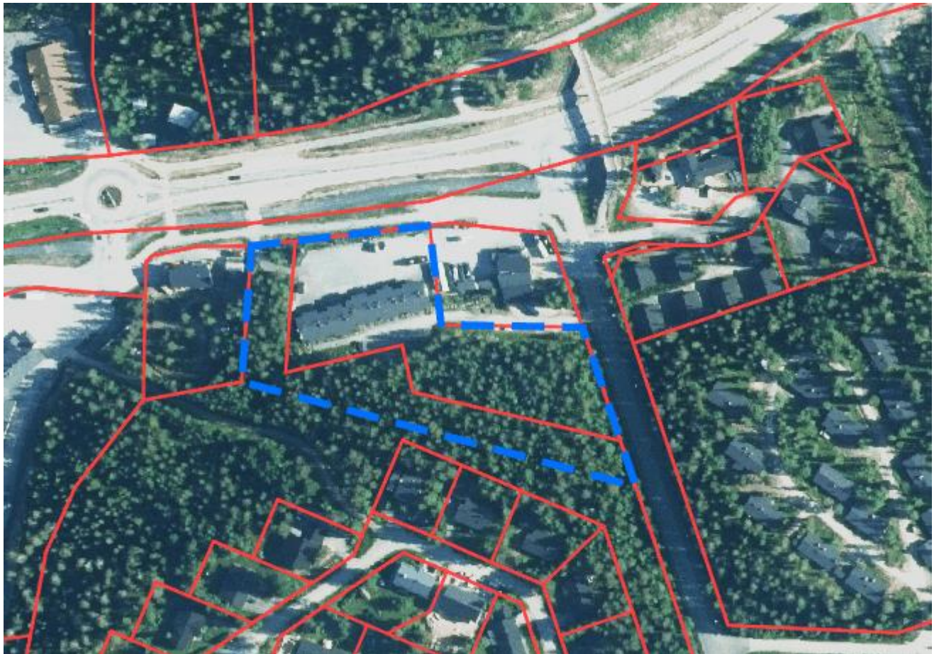
Arvioitu kaava-alueen rajaus

Asemakaavan muutos koskee kiinteistöjä 305-416-19-106 ja 305-2-9903-10.