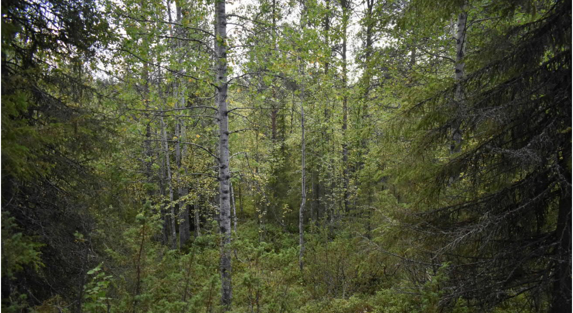
Kuva 2. Saarua-ahon selvitysalueen metsät ovat puustoltaan nuorta.

ei sijoitu erityisiä luonnontilaisia arvokkaita luontotyypppejä. Alueen välittömään lähiympäristöön sen sijaan sijoittuu arvokkaita lettoja sekä uhanalaisen lajin esiintymä ja vaateliaan lajiston esiintymispotentiaalia.