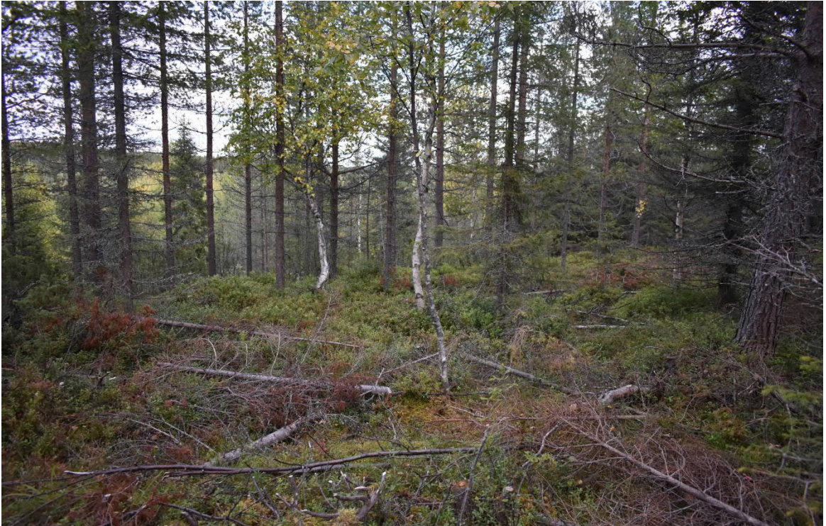
Kuva 4. Ylä ja alakuva, Saarua-ahon alueen 2 tasaikäistä talousmetsämännikköä.

Toinen selvitysalue sijoittuu Saarua-ahon itäosaan, jo rakennetun loma-asuntoalueen viereiseen rinteeseen. Metsä on tyypiltään mäntyvaltaista kuivahkoa kangasta. Selvityskohteen männikkö on suhteellisen tasaikäistä ja sitä on vasta harvennushakattu. Alueella ei ole erityisiä luontoarvoja.