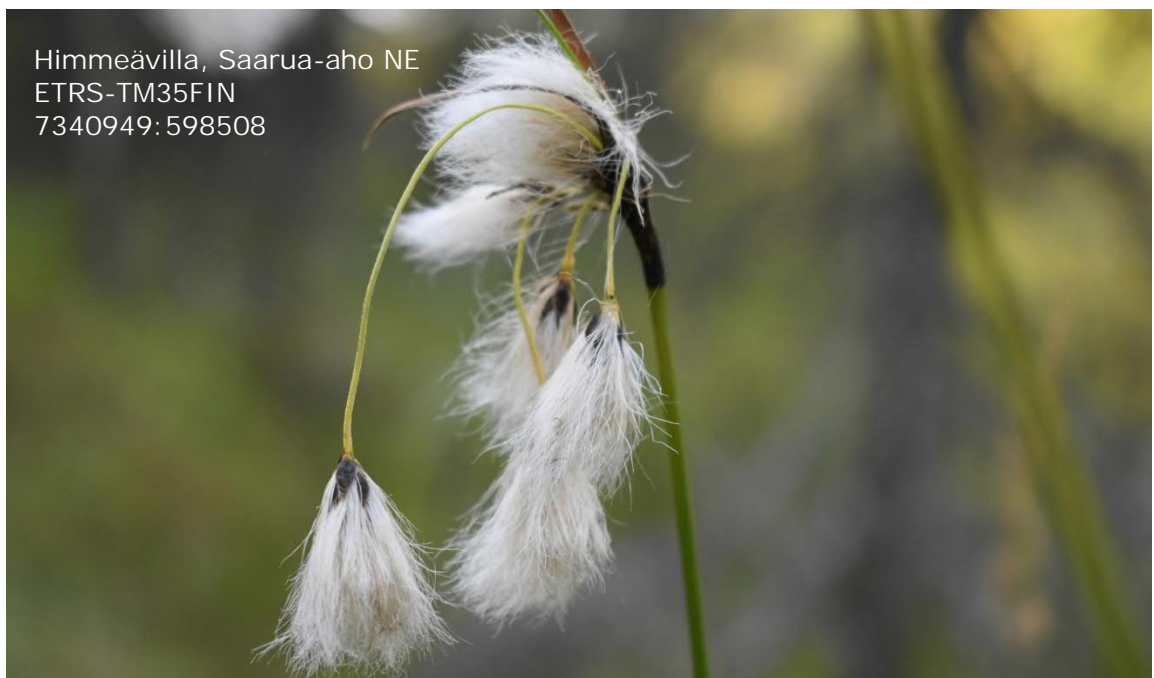
Kuva 3. Uhanalaisen himmeävillan esiintymä sijaitsee suojelualan ja selvitysalueen rajalla.

Inventoinneissa Natura-alueen rajalla havaittiin himmeävillan ( Eriophorum brachyantherum ) esiintymä, suojelualan puolelle sijoittuvan lettonevan ja -korven tuntumassa. Himmeävilla on vuoden 2019 uhanalaisuusluokituksessa vaarantunut (VU) laji.