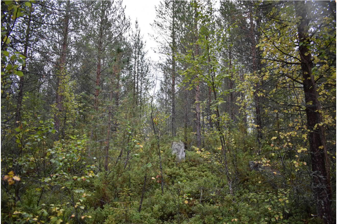
Kuva 6. Keisarinrinteen selvitysalueen talousmetsiä.