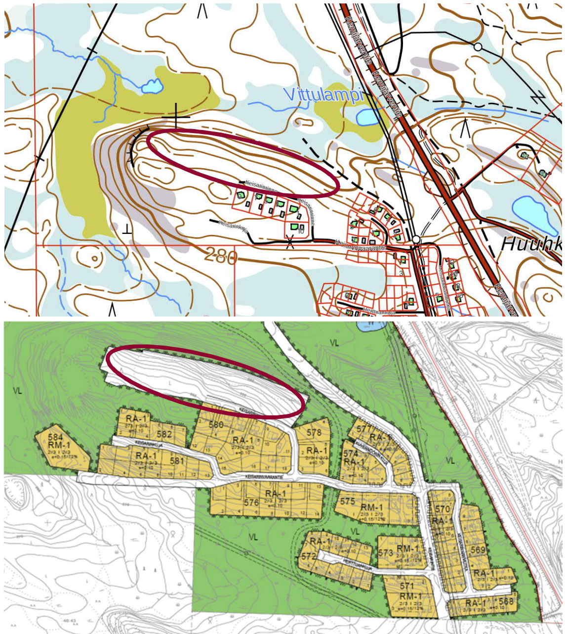
Kuva 5. Selvitysalue Keisarinnteellä.

Keisarinrinteen kaava-alueelle sijoittuu kaavan ulkopuolelle jäänyt rinteeseen pohjoisosa, jonka luontoarvoja selvitettiin. Alueella on nuorta tasaikäistä kuivahkon kankaan männikköä melko jyrkässä rinteessä. Rinne on kivinen ja männikkö on tiheäkasvuista ja pääosin harventamatonta. Rinteessä on tn. hirven talvilaidunalueita, sillä männynissä on paljon hirven syönnösjälkiä. Selvitysalueen länsiosassa on selkeä metsäkuvion raja, ja harjun kärjessä on puustoltaan monipuolinen, myös lahoppua sisältävä kalliometsä. Länsiosan kallioilta avautuu hienot maisemanäkymät voimajohtolinjoja lukuun ottamatta. Selvitysalueella (punainen rajaus, kuva 6) ei ole erityisiä luontokohteita tai kasvistollisia arvoja.