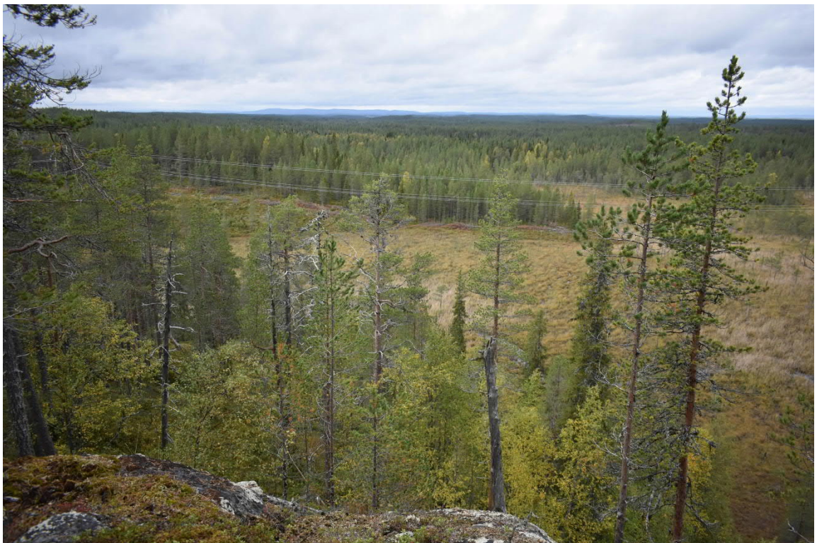
Kuva 7. Näkymiä keisarinrinteen selvitysalueen länsipuolen kallioalueelta.